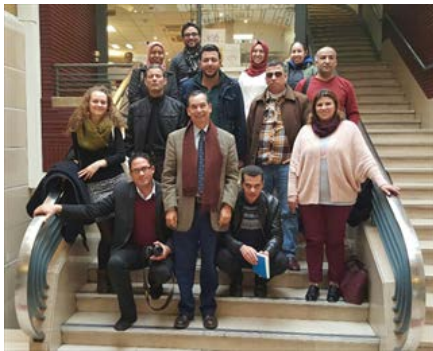
4 - L'équipe du MJS

Dans le cadre du programme « micro-entrepreneuriat pour jeunes défavorisés » financé par la Banque Mondiale et géré par le Ministère de la Jeunesse et des Sports, ACIM, en partenariat avec l'AFD, a mis en place un programme de formation de 21 jours pour renforcer les compétences des accompagnateurs de jeunes entrepreneurs.