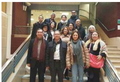
1 - L'équipe du MJS

22/02/2016 – ACIM a reçu à Marseille 12 cadres institutionnels du MJS-Ministère de la Jeunesse et des Sports du Maroc- pour une semaine de rencontre et d'échanges autour de l'accompagnement des entrepreneurs