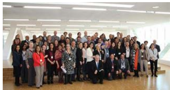
8 - Les acteurs du Forum réunis pour la signature de SIEMed

Le réseau est coordonné par l'agence ACIM, qui a d'ores et déjà entrepris des démarches auprès d'organisations internationales (l'Union pour la Méditerranée, l'Agence Française de Développement et l'Union Européenne, la Banque Mondiale) en vue de faire reconnaître et soutenir le réseau. C'est la première fois que des structures marocaines, tunisiennes, algériennes, libanaise et égyptienne s'unissent au sein d'un réseau commun pour le développement et le renforcement de l'entrepreneuriat en Méditerranée !