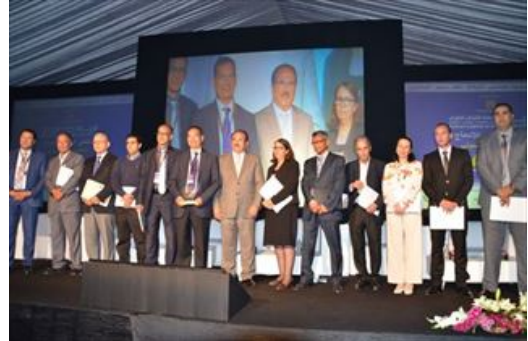
6 – Remise des attestations en présence de SE le Ministre de la Jeunesse et des Sports

Cette cérémonie a clôturé avec succès les programmes de formation entrepris par ACIM et ses partenaires et a ouvert le champ à d'éventuelles nouvelles perspectives de collaboration. Cette rencontre marque une nouvelle fois l'engagement d'ACIM et de ses partenaires en faveur du développement de l'entrepreneuriat en méditerranée.