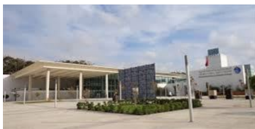
5 - Ministère de la jeunesse et des Sports Rabat, Maroc

Le 25 mai, ACIM et ses partenaires marocains ont remis à 150 stagiaires leur attestations de formation à la création d'entreprises, lors d'une cérémonie officielle organisée en partenariat avec le Ministère de la Jeunesse et des Sports du Royaume du Maroc.