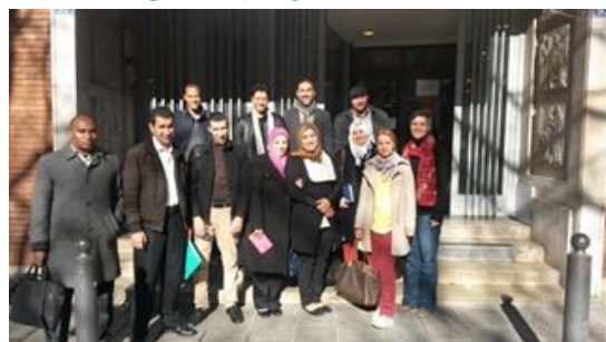
2 - Groupe de l'ADS

22/02/2016 – ACIM a reçu à Marseille 12 agents de Développement de l'ADS (Maroc) pour une semaine de rencontres et d'échanges autour de l'accompagnement et de l'amorçage de projets