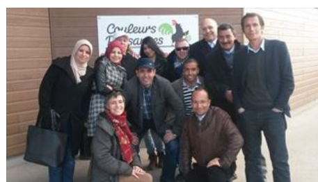
3 - Visite de l'UTSS

En partenariat avec le Conseil Régional Provence Alpes Côte d'Azur et l'Agence Française de développement, l'ACIM a accueilli son partenaire tunisien l'UTSS ainsi que 5 personnes de 3 groupements différents.