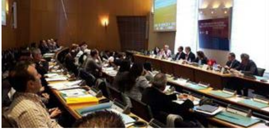
9 – DiasporaLab 2016

Durant 2 jours, les 25 et 26 janvier 2016, une trentaine de porteurs de projet ont bénéficié du DiasporaLab mis en œuvre par ACIM et FCM (Finances et Conseils Méditerranée) à Marseille, en partenariat avec la CCI Marseille Provence, la CCIS de Casablanca et l'AHK au Maroc.